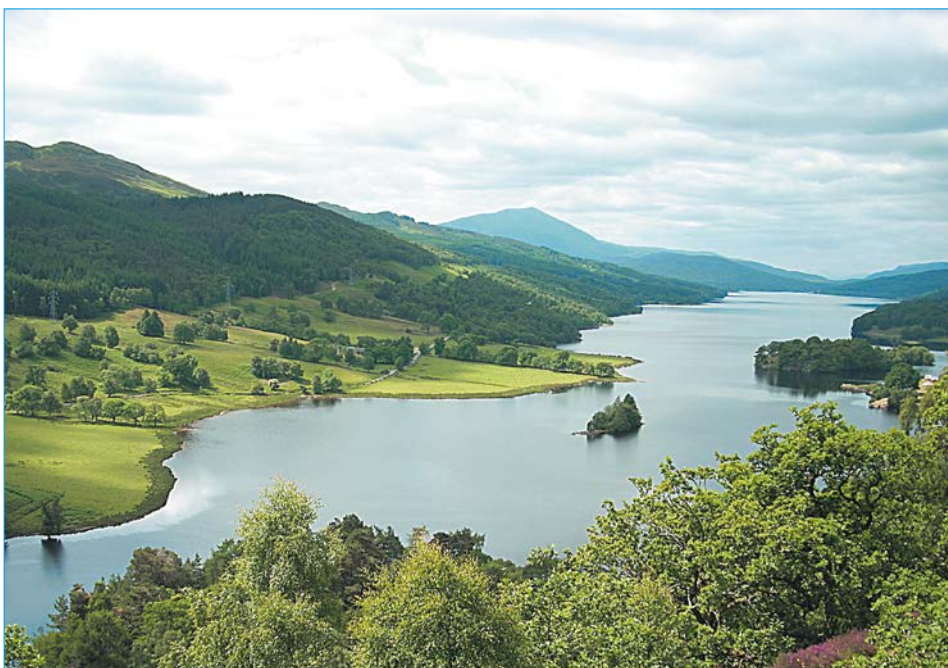
Un long fleuve tranquille.

Ils ont tous eu recours à l'homéopathie ! (source Homeopathy Plus)