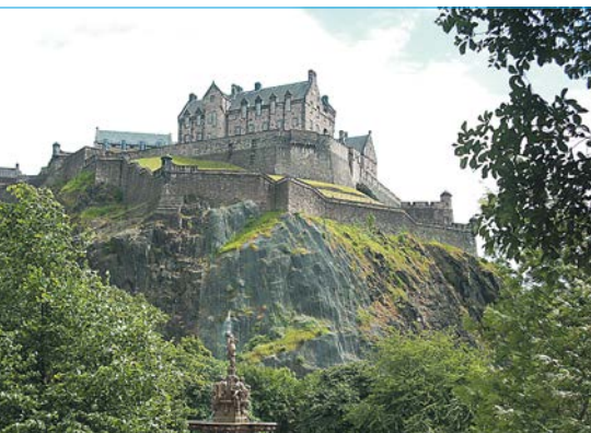
Le château d'Edimbourg.

Ouverture de la séance par la présidente, et validation du compte rendu de la dernière assemblée générale.