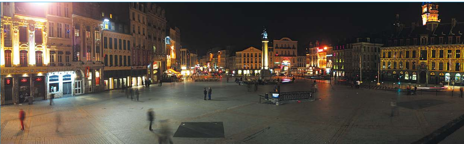
Vue panoramique de la Grand-Place dans le cœur de Lille, la nuit.

pluralisme raisonné que nous avons présenté en son nom. C'était son principal message que nous tâchons de sauvegarder et d'enrichir avec la pratique des uns et des autres. Le médicament homéopathique et ses indications ne doivent pas nous faire perdre de vue les notions pharmacognosiques et physiopathologiques. Malgré cela il restait ouvert aux différentes pratiques de notre milieu homéopathique et nous tâcherons d'en faire de même dans les